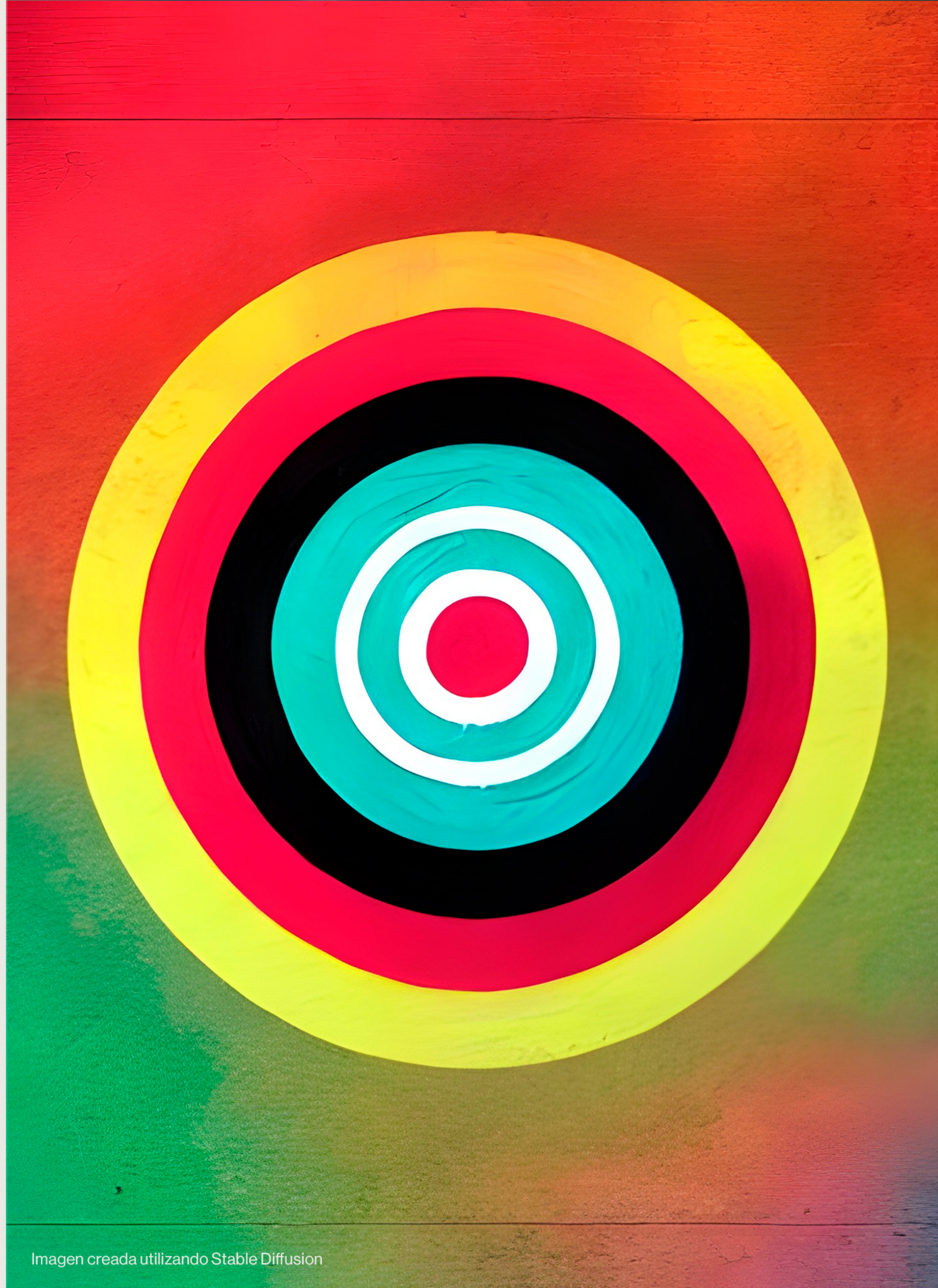
Imagen creada utilizando Stable Diffusion

Para que nuestros planners den (aún más) en el clavo.