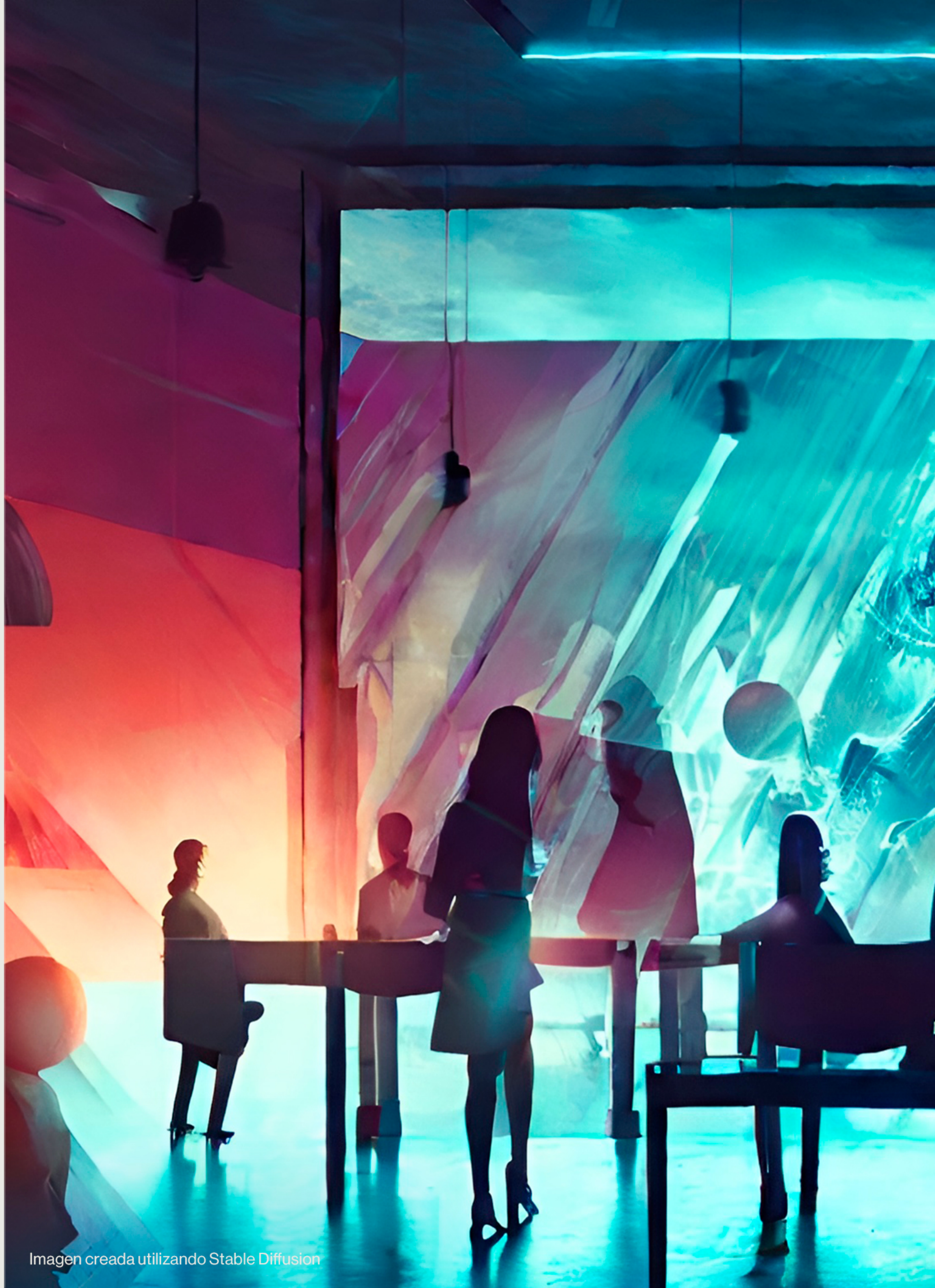
Imagen creada utilizando Stable Diffusion

Cómo ahorrar tiempo a los creativos (o hacer que salgan a su hora).