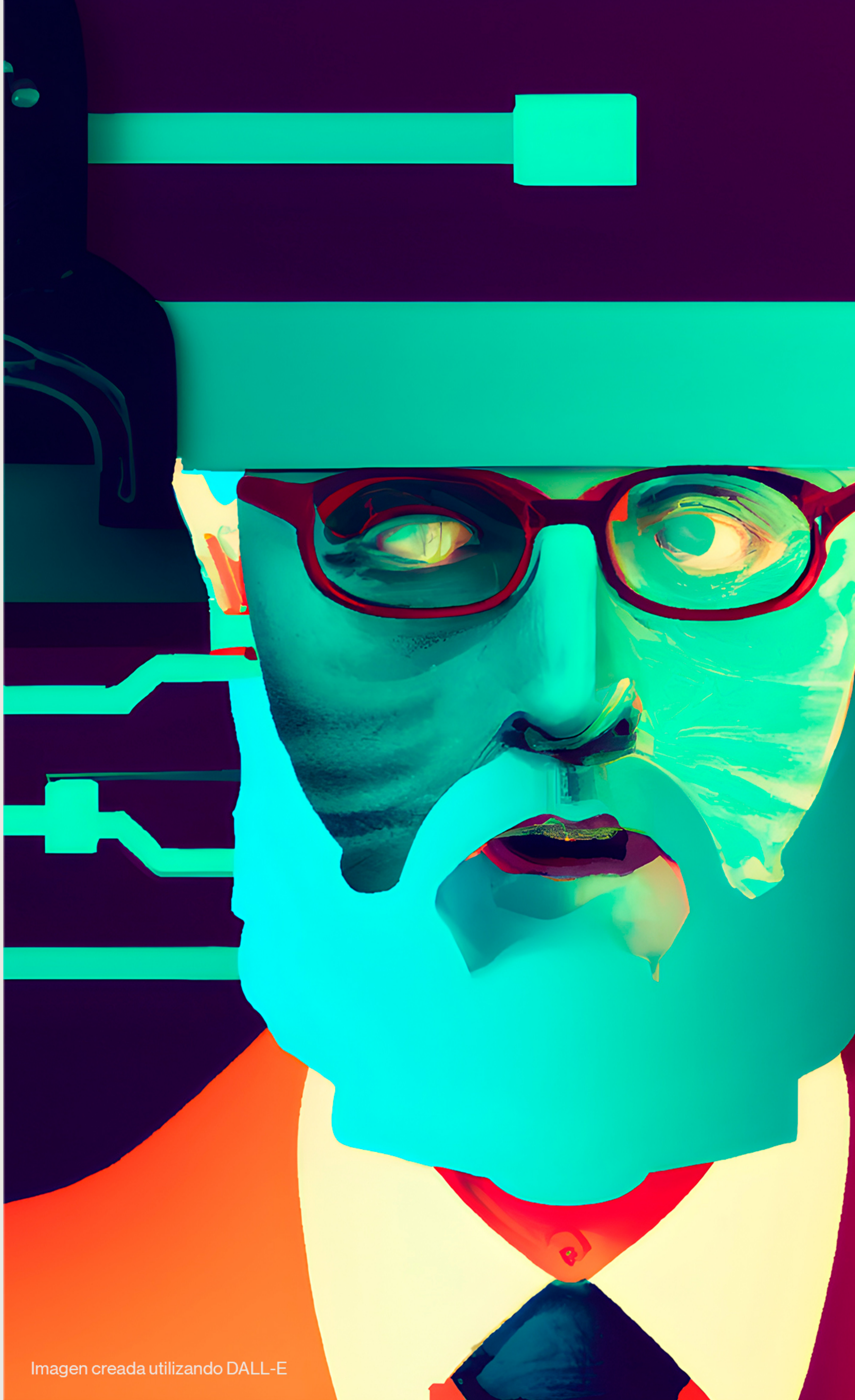
Imagen creada utilizando DALL-E

Un empujoncito para hacer más ágiles nuestras estrategias de SEO.