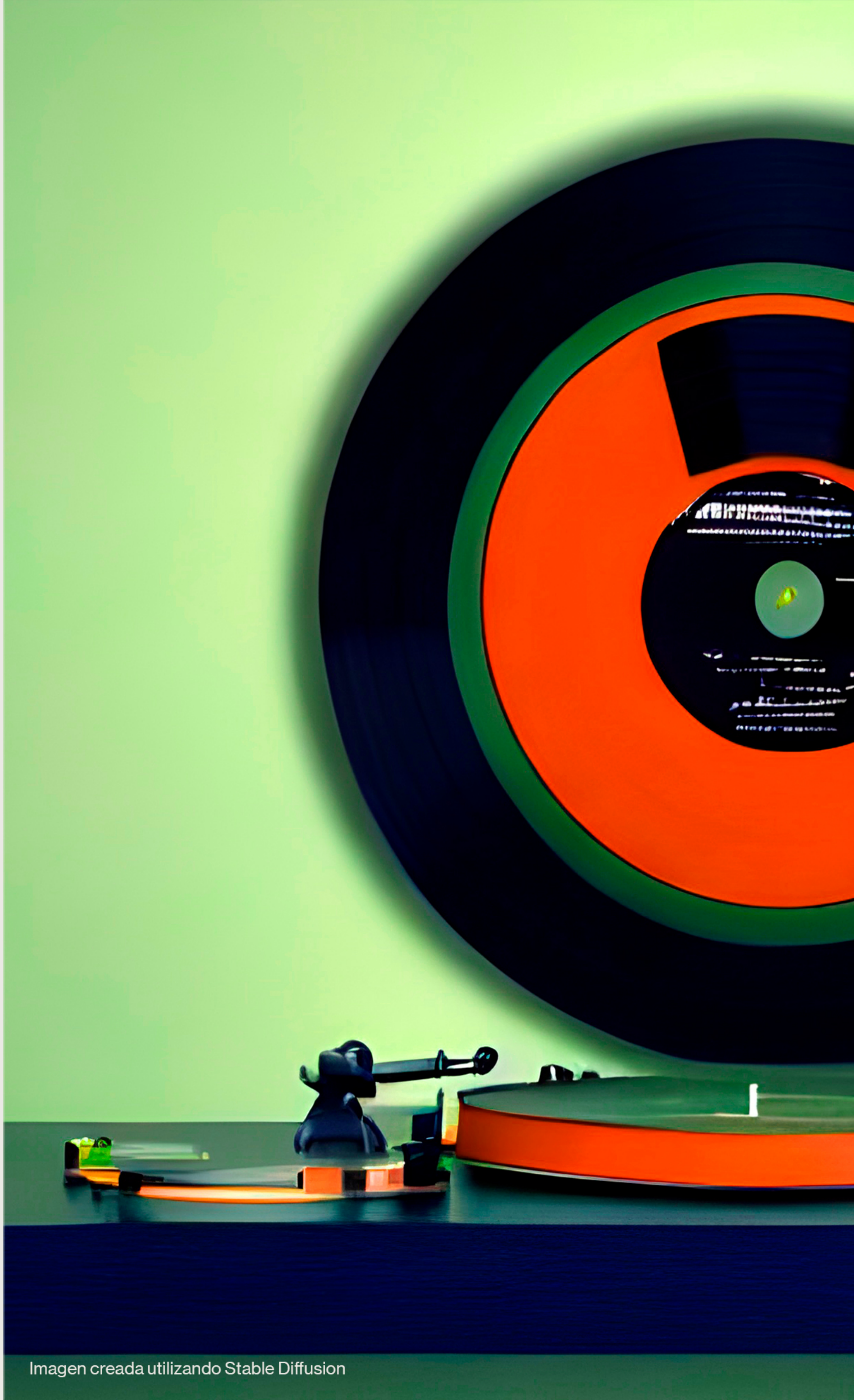
Imagen creada utilizando Stable Diffusion

Unos trucos que te harán sentirte todo un pro de ChatGPT.