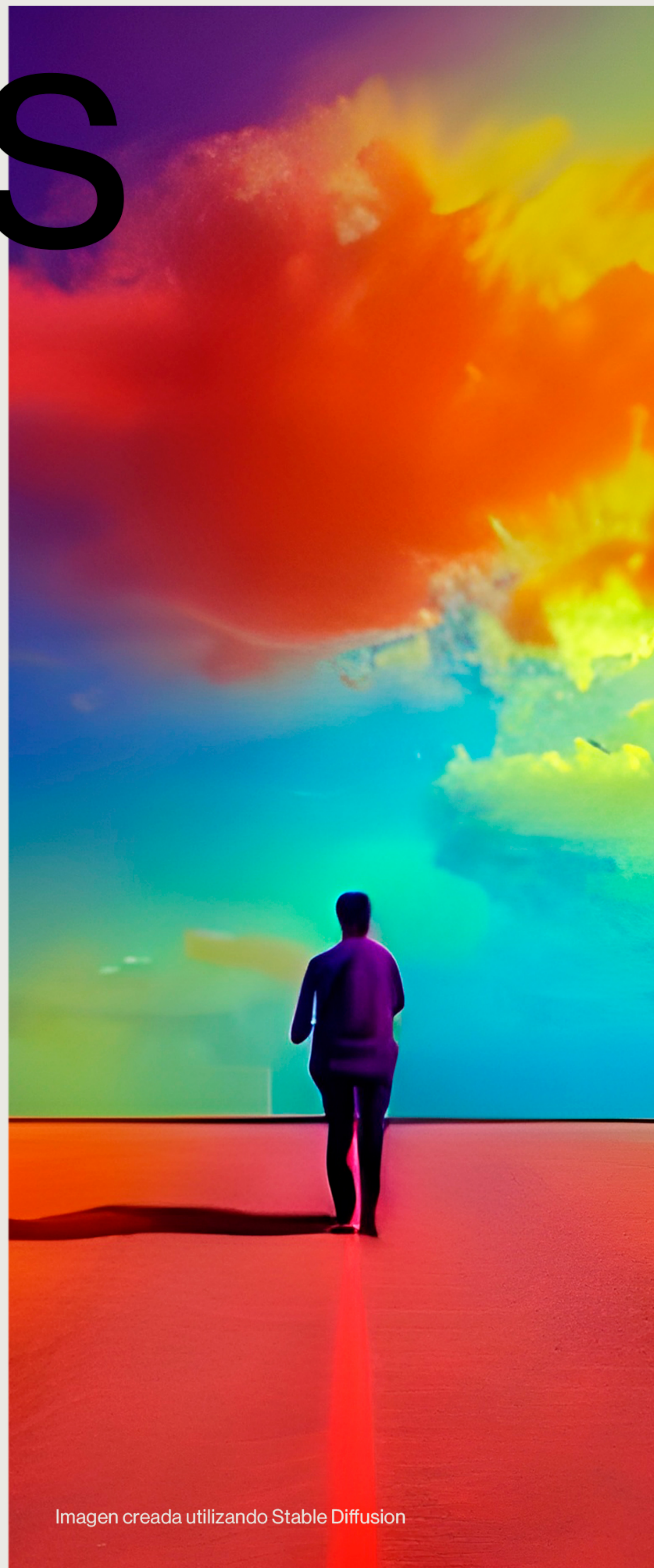
Imagen creada utilizando Stable Diffusion